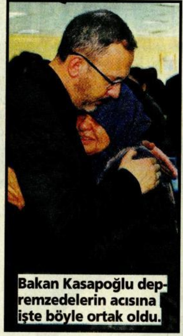
Bakan Kasapoğlu depremzedelerin acısına işte böyle ortak oldu.

fetten, battaniyeye, çadıra kadar tüm malzemeler gönderiliyor. 12 ilde bakanlığımız tesislerini 10 ilden transfer edilecek vatandaşlara yönelik hazırladık. 34 gençlik merkezi, 23 yurt ve 95 spor tesisi olmak üzere toplam 152 tesiste 150 binden fazla depremzedemiz konaklıyor" dedi.